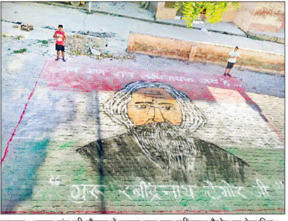
झज्जर। भदना गांव की चौपाल में बनाया गया गुरु रवींद्रनाथ टैगोर का रेखाचित्र।