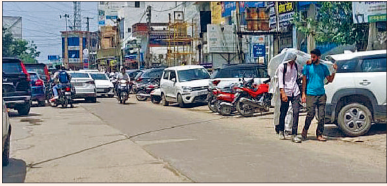
झंझर। कपड़े की सहायता से स्वयं को तेज धूप से बचाते युवा।