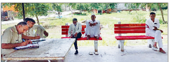
झंझर। नागरिक अस्पताल परिसर में गुरुवार को पोस्टमार्टम के लिए कागजी कार्रवाई करते हुए पुलिसकर्मियों।