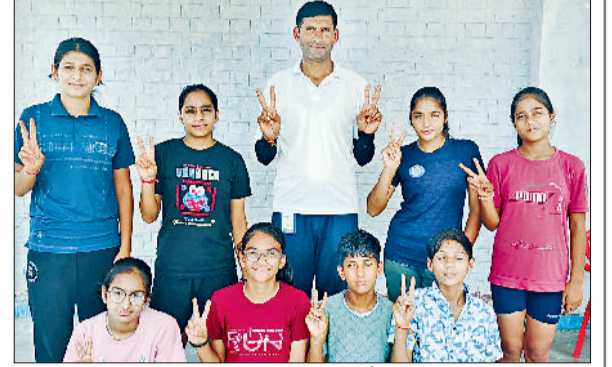
झज्जर। शिक्षक के साथ उपस्थित विजेता खिलाड़ी छात्राएं।