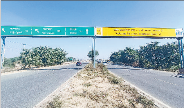
बहादुरगढ़। रोहतक रोड पर बना एनएच-344 एन का एंटी एग्जिट प्वाइंट।

दिल्ली-एनसीआर में बढ़ते ट्रैफिक दबाव को कम करने के उद्देश्य से अर्बन एक्सटेंशन रोड-टू के नाम से शुरू हुआ प्रोजेक्ट अब नेशनल हाइवे-344 एम-एन-पी के रूप में पूरा होने जा रहा है। प्रधानमंत्री नरेंद्र मोदी 16 अगस्त को अर्बन एक्सटेंशन रोड-टू (नेशनल हाइवे-344 एम-एन-पी) और द्वारका एक्सप्रेस-वे के दिल्ली सेक्शन का उद्घाटन करेंगे। इसके दिल्ली के विभिन्न क्षेत्रों से गुरुग्राम, बहादुरगढ़, रोहतक व सोनीपत का आवागमन सुगम हो जाएगा। इस अवसर पर केंद्रीय मंत्री नितिन गडकरी और प्रदेश के