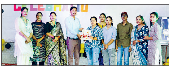
झज्जर। होमहार विद्यार्थियों को सम्मानित करते हुए स्टॉफ सदस्य। फोटो: हरिभूमि

झज्जर। राष्ट्रीय कृषि मुक्ति दिवस कार्यक्रम का आयोजन आगामी 26 अगस्त को जिला भर में किया जाएगा। भारत सरकार और एनएचएफ, हरियाणा आगामी 18वें डीवॉर्मिंग राउंड को संस्थान आधुनिक निश्चित दिन के दृष्टिकोण से लागू करने के लिए तैयार है। यह बात डीसी स्वप्निल रविंद्र पाटिल ने वीरवार को राष्ट्रीय कृषि मुक्ति कार्यक्रम, मलेरिया और डेंगू की रोकथाम को लेकर अधिकारियों को बैठक में आवश्यक दिशा निर्देश देते हुए कही। राष्ट्रीय कृषि मुक्ति दिवस 26 अगस्त को होगा और 2 सितंबर 2025 को गौप-अप दिवस मनाया जाएगा। इस अभियान के तहत एक से 19 वर्ष आयु वर्ग के 3 लाख 13 हजार 508 बच्चों और 26 हजार से ज्यादा महिलाओं को कृषि मुक्ति करने का लक्ष्य निर्धारित किया गया है।