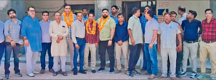
बहादुरगढ़। साथियों के संग चुने गए पदाधिकारी।