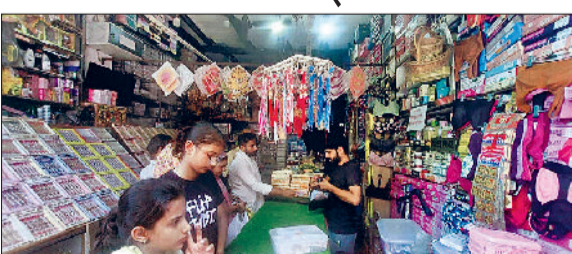
झंझर। बाजार में दुजान पर राखियों की खरीदारी करती युवती एवं महिलाएं। बच्चों के लिए बाजार में उपलब्ध आकर्षक एवं सेंसरयुक्त घड़ीनुमा राखी।