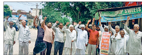
झज्जर। विभिन्न मांगों को लेकर रोष प्रदर्शन करते हुए ऑल इंडिया किसान खेत मजदूर संगठन के पदाधिकारी एवं कार्यकर्ता।