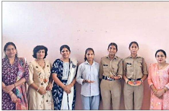
बहादुरगढ़। प्रतियोगिता की विजेता छात्राओं के साथ कॉलेज स्टाफ।