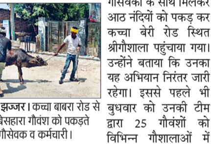
गौसेवकों के साथ मिलकर आठ नदियों को पकड़ कर कच्चा बेरी रोड स्थित श्रीगौशाला पहुंचाया गया।