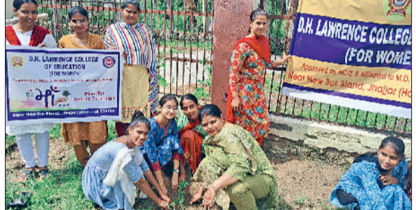
झज्जर। शिक्षकों के साथ मिलकर कॉलेज परिसर में पौधरोपण करती छात्राएं।