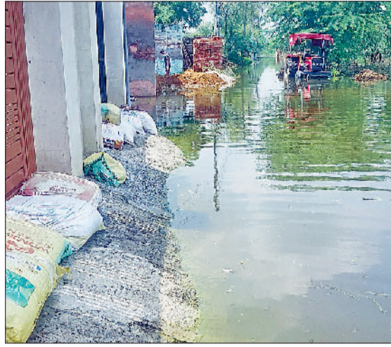
झज्जर। दूबलधन गांव की गलियों में भरा बरसाती पानी व गांव के बुढ़ो माता मंदिर के चारों ओर भरा बरसाती पानी।

हरिजन कालोनियों, पीपाला कांधावाली व कालियावाला में जलस्तर काफी बढ़ा हुआ है। सभी जोहड़ व तालाब ओवरफ्लो हो गए हैं तथा श्रद्धा की धर्मशाला और तिहाग मोहल्ले में पानी से दुर्गंध उठ रही है।